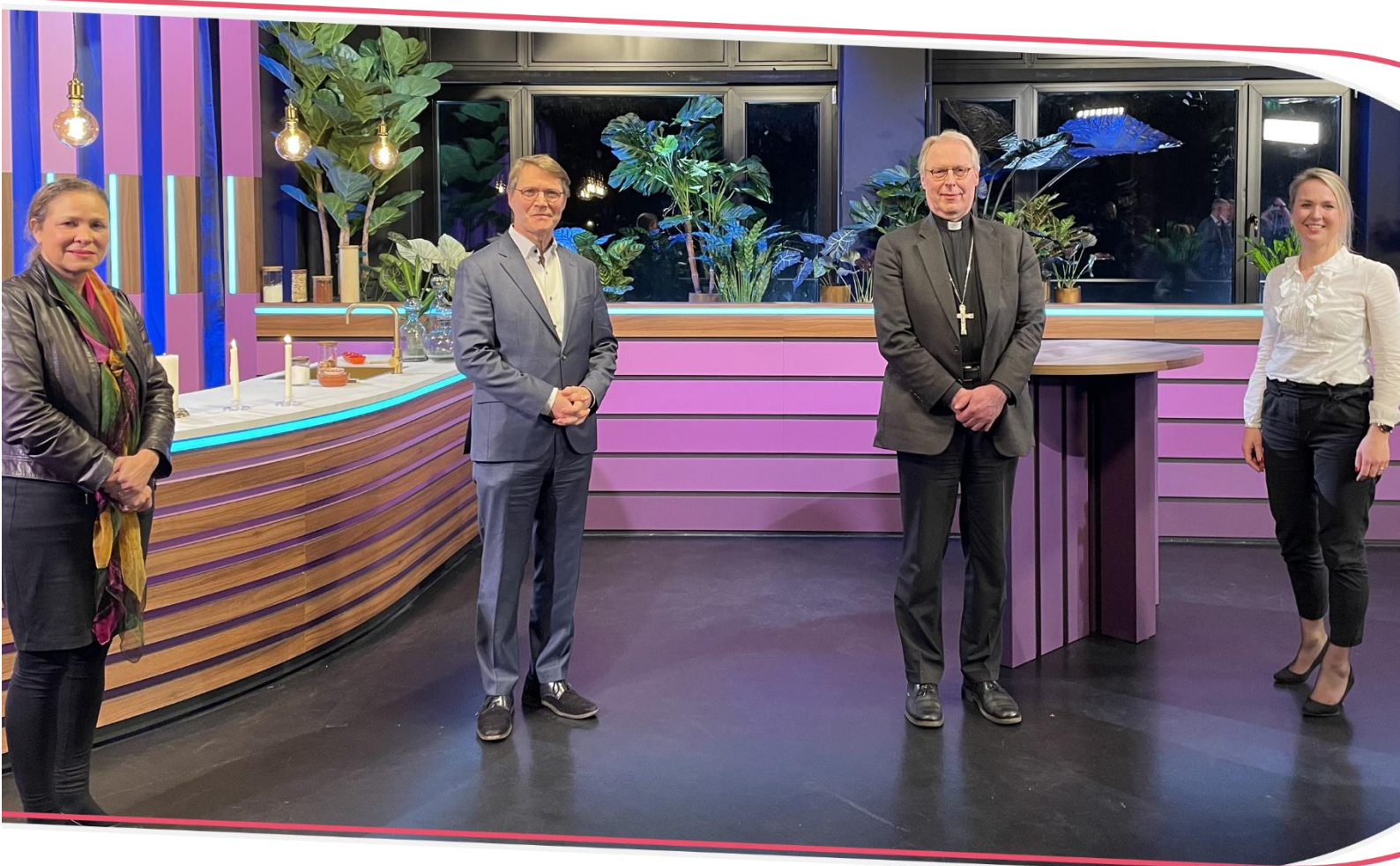
Tijdens een Nationaal Gebed voor vrede en verbinding werd gebeden voor verzoening naar aanleiding van de polarisatie die de coronacrisis heeft meegebracht. Vertegenwoordigers van diverse kerkgenootschappen en koepels spraken vanuit de EO-studio een gebed uit.